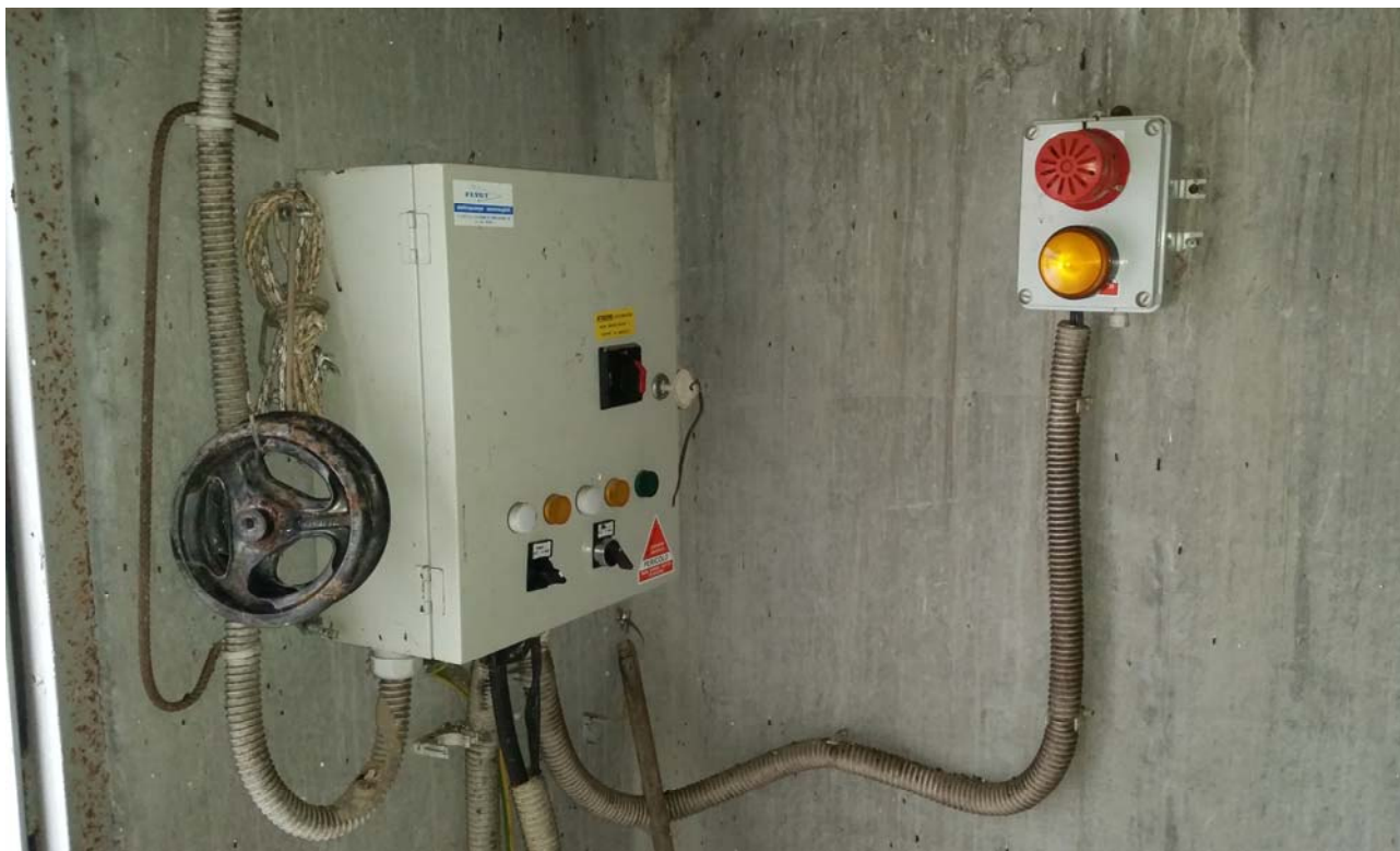
Fotografia 05 – Quadro elettrico