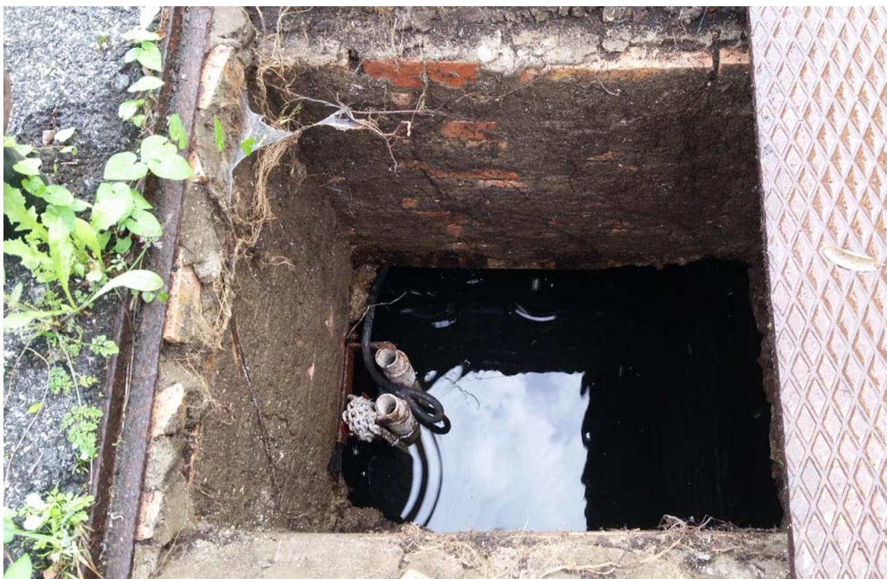
Fotografia 04 – Vasca alloggiamento elettropompe