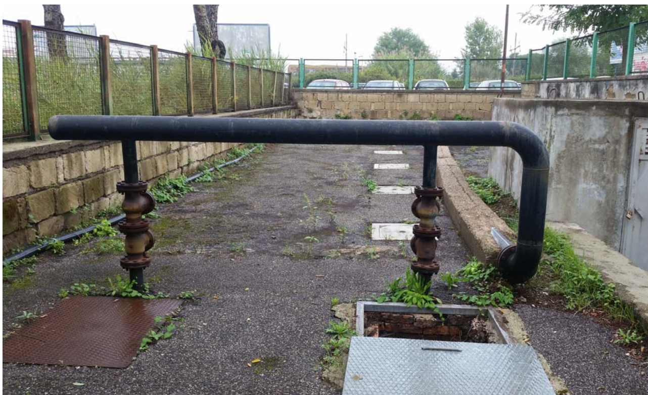
Fotografia 03 – Manovra